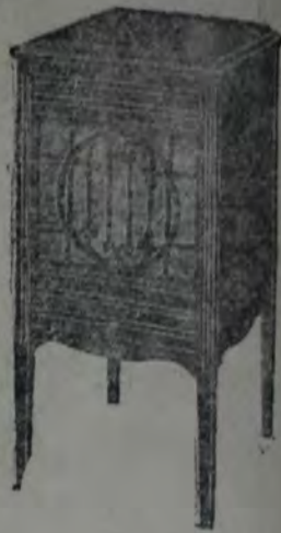
Gramófono, caja de madera lustrada al "Ducó", con linda calca en el frente y departamento para discos, máquina de doble cuerda con plato de 25 centímetros, brazo curvado y dos tacer. Membrana para pds., membrana tapada muy sonora, a . . . . . 130