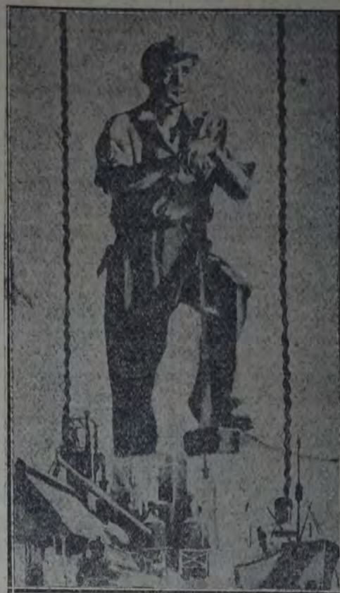
LA INTERNACIONAL SINDICAL

manal, gracias a la acción constante, tesonera y seria que con tanto acierto ha venido y viene desplegando la meritoria organización gremial tranviaria. La asamblea referida constituyó una verdadera prueba de la confianza y el prestigio que la "Unión Tranviarios" merece entre los trabajadores del tranvía.