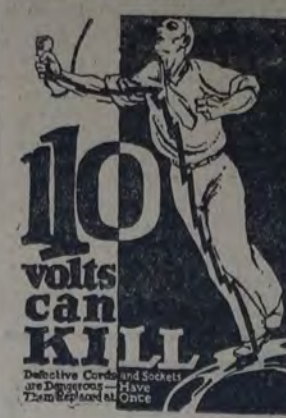
110 voltios pueden matar! Los artefactos y los cables en mal estado son peligrosos. Hacedlos reemplazar de inmediato.

En la tarde de ayer en una de las habitaciones de la casa de la calle 2162, ocurrió un accidente de fatales consecuencias para el niño Horacio Berlingieri, argentino, de 10 años de edad.