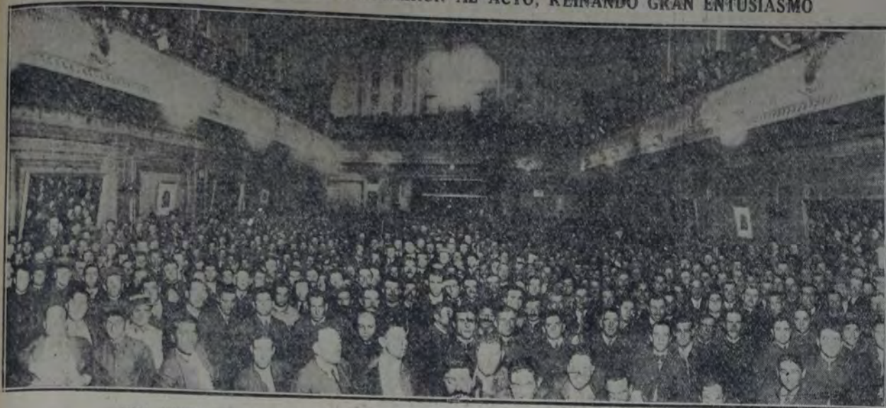
UNA VISTA DE LA CONCURRENCIA A LA ASAMBLEA REALIZADA POR LOS TRANVIARIOS

NUMEROSOS OBREROS CONCURRIERON AL ACTO, REINANDO GRAN ENTUSIASMO