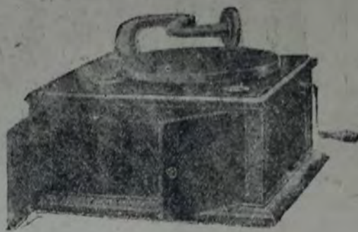
Gramófono sin bocina, caja de roble color claro, con celosías y puertas. Máquina buena, de una cuerda. Membrana de metal empavonado. Aparato lindísimo, a . . . . . 32